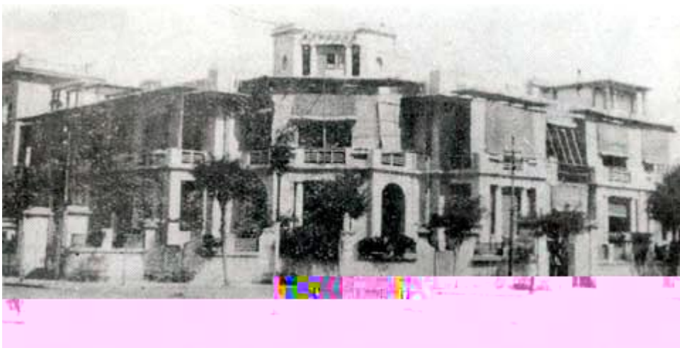
华北水利委员会外景（旧址仍存且已获修复，位于天津市自由 民生 交口西北角）

函示以便接洽”。1931年1月9日，华北水利委员会第67次常务会“决议本会与河北工业学 合办水工试 场各担负开办设备 之一半，由该 拨给场址及由该 挪出一万五千元现款外并由本会于每次 到经 中储存十分之一作为专款 同该 专款交由双方合组之保管，委员会负 保管以作将来建筑及设备之用”。并 成协议：1、河工试 场改称水工试 场，建筑在河北省立工业学 内；2、试 场的规划设计，由工业学 水工讲师李 博士筹办；3、参建单位各尽 力所能，自认投 数 ，差 分协商解决；4、试 场建成后，由工业学 代管，管理办法另定。至此，河北省立工业学 成为最早与华北水利委员会合办水工试 所的学术机关。